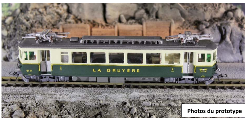
Photos du prototype